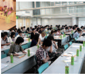
昨年の会場の様子

まずはご自宅に届く案内を開けてみてください。そして内容をご確認ください。そして内容をしっかりと読んでください。多忙の中、なかなか時間が取れないとは存じますが、「一日だけお時間を下さい。」きつと何かを得ていただけは、必ずです。 「きずな」の大切さが再認識されている昨今、地元地域の皆様との関係、家族との関係を深めるチャンスでもあります。皆様の積極的なご参加をお待ちしております。