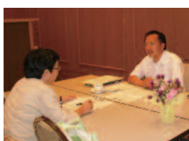
個人面談ではどんなことでもご相談ください。

約40年間、毎年開催されており、実績と経験を元に、「一人でも多くの会員に参加していただける懇談会」、「参加していただいた会員に満足してもらえ懇談会」を目指し、工夫と努力を重ねてきました。 また大学側も、支部長をはじめとする支部役員の皆様の熱意に応えるべく、全面的に協力の体制を整えています。